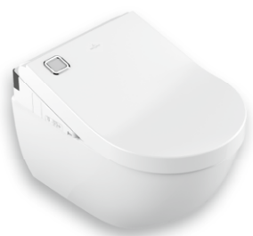
ViClean-U+ Subway 2.0 DirectFlush