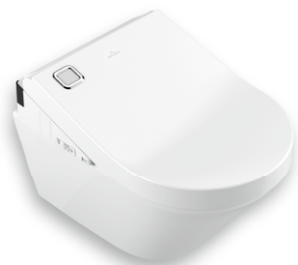
ViClean-U+ Vivia DirectFlush